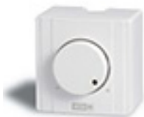
PA10 PU10 ESA1 ESA3